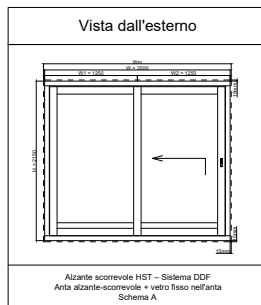
Parametri delle porte della terrazza HST (2500 x 2150)